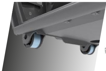
Sessiz Ön Bloklar

Kabinin hidrolik süspansiyonu sallantıyı etkili bir şekilde azaltır ve yanal, dikey, arka ve ön olmak üzere tüm yöndeki darbeleri ve sarsıntıları emen 4 destekleyici ile yüksek sürüş konforu sağlar.